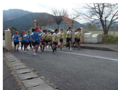
【 2600m 】