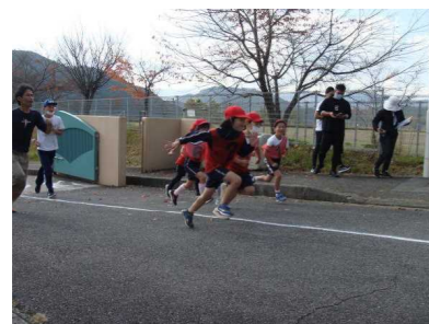
【 1000m 】

11月2日に1年生～6年生の校内マラソン大会を開催しました。2週間前からまずは、朝タイムの時間を利用して「かけ足」をスタート。1000m、1800m、2600mのコースから自分がチャレンジしようと思うコースを選んで、自己記録の更新を目指して一人ひとりが力走を見せてくれました。走り終わった人が、友だちに励ましの声援を送っていた姿を見ることができ微笑ましく思いました。保護者の皆様、応援ありがとうございました。