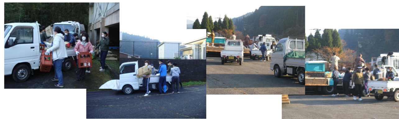
【下会場：旧下曾爾小駐車場】

11月20日(土)晴天ではあるものの冷たい風が吹く中、2カ所に分かれて廃品回収とベルマーク回収を行いました。保護者の皆様や地域の皆様のおかげで、多くの資源を回収することができました。収益金については、小中学校で子どもたちの学習等に活用させていただきます。ご協力ありがとうございました。