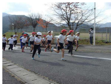
【 1800m 】